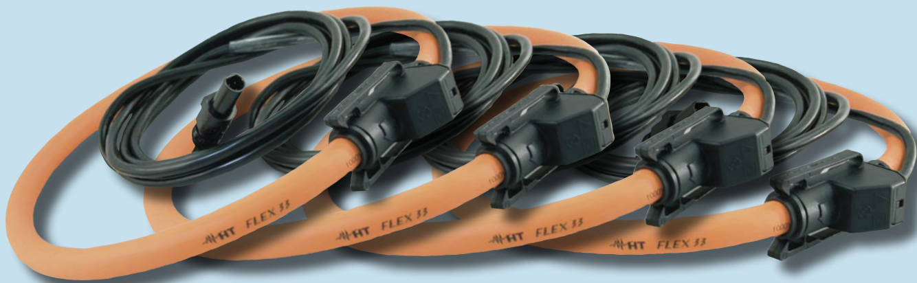
Elastyczne przystawki prądowe HTFLEX33 300A/3000A (na wyposażeniu zestaw 4 sztuk)

Możliwość rozpinania, duża średnica wewnętrzna oraz elastyczność zapewniają niezwykle komfort i uniwersalność zastosowań.