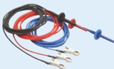
Nr kat. 8101-181

Zestaw (3x3m) WN przewodów pomiarowych, z 10kV izolacją chwytaków