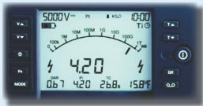
Widok wyświetlacza i przycisków sterujących MIT520