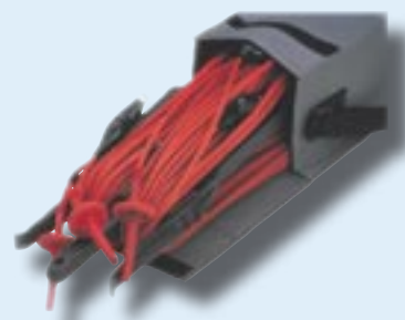
Nr kat. 6311-080

Zestaw (3x3m) WN przewodów pomiarowych, chwytaki okrągłe bez izolacji