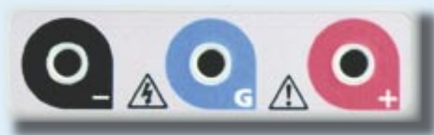
Zaciski pomiarowe z blokadą przewodów

W trybie transmisji wyniki wartości napięcia probierczego, prądu upływności i rezystancji izolacji są wysyłane, co 1 sekundę, przez gniazdo RS-232 lub USB do PC. Tryb „na żywo” pozwala na wykonanie długotrwałych rejestracji wymagających dużej pojemności pamięci, jaką zapewniają dyski PC. Współpracę z PC umożliwia, będący na wyposażeniu, program Download Manager w języku polskim.